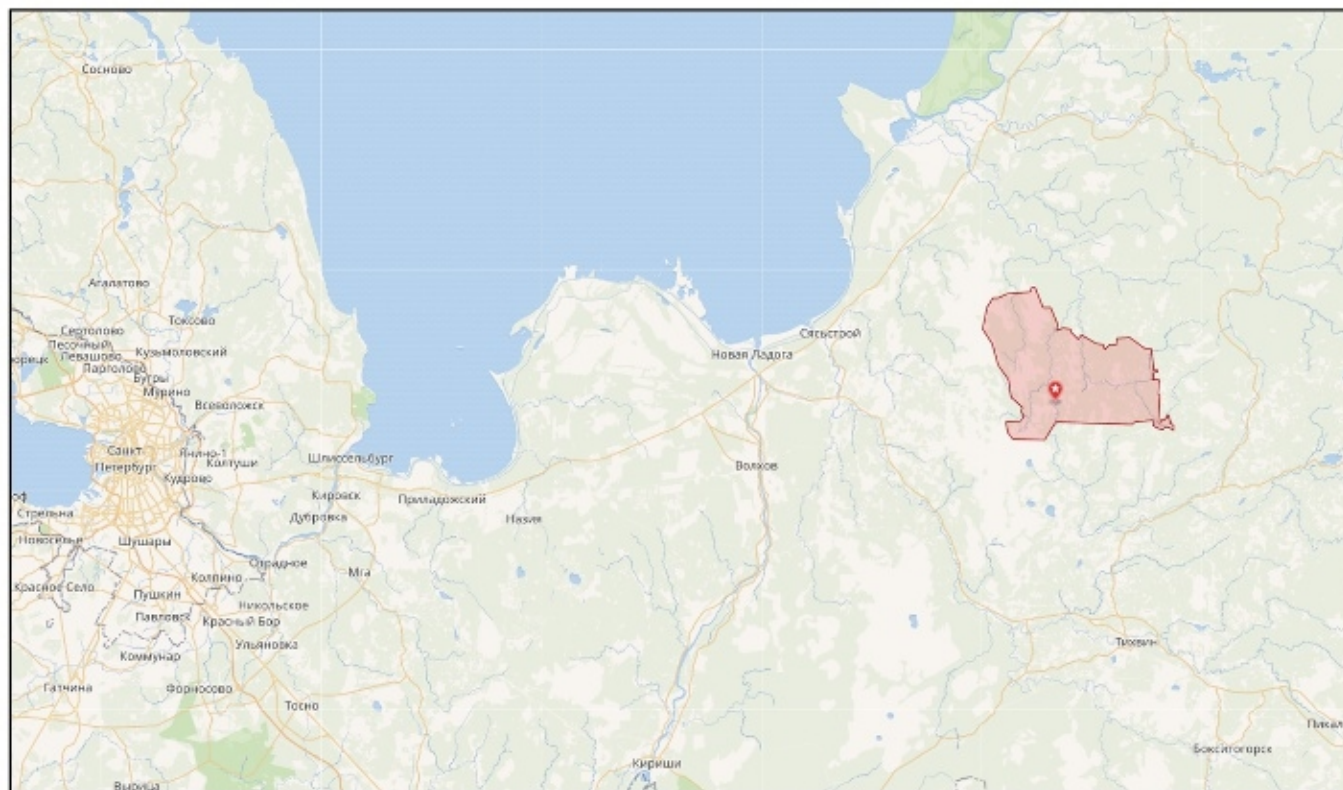
Рисунок 2 – Расположение административного центра – д. Коськово